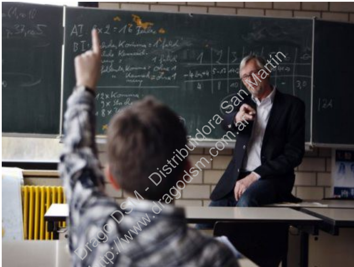
La vocación de enseñante: maestros

Las personas trabajan porque les gusta trabajar y eso es independiente de la remuneración, aunque los niños de este nivel (hasta los 10-11 años) señalen que se gana dinero trabajando. El almacenero vende porque le gusta vender y el maestro enseña porque le gusta enseñar a los niños. El maestro puede mandar a los niños lo que quiera, pero nunca les ordenará hacer cosas que no se deban hacer o que quede fuera del ámbito de su competencia.