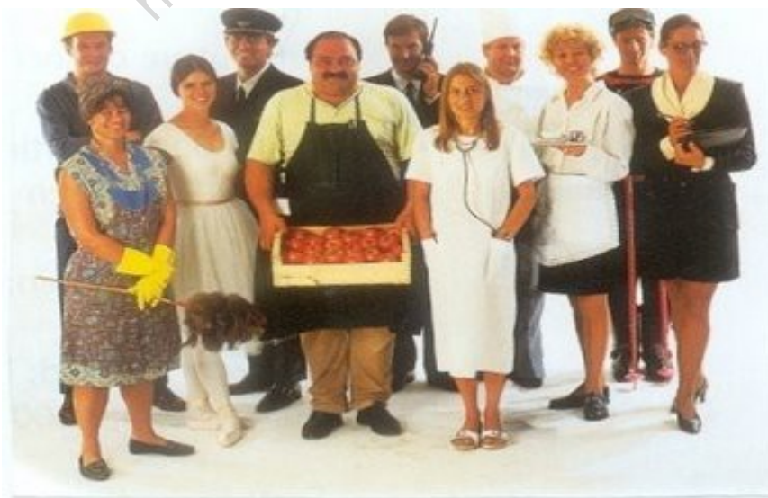
Profesiones y atributos profesionales

Los reyes van con coronas. Una de las limitaciones para adquirir una profesión es tener que comprarse los instrumentos que la caracterizan. Parecería que esos rasgos externos son los que definen el estatus de las personas.