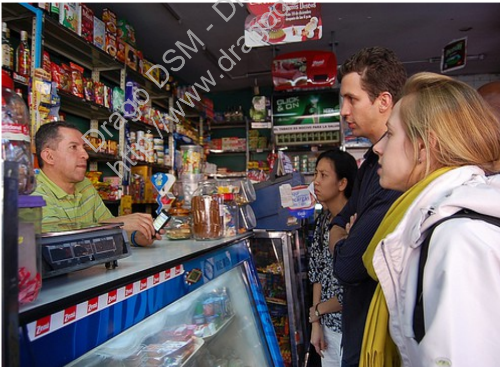
Almacenero con sus clientes

Parece suponerse en las explicaciones (de los niños) que las acciones que los individuos realizan están dirigidas ante todo por sus deseos, sin que se tengan presentes las restricciones de la realidad. Para desempeñar una profesión hay que desear tenerla. El almacenero vende las cosas más baratas o más caras, con independencia del precio de coste, porque quiere ganar más o menos.