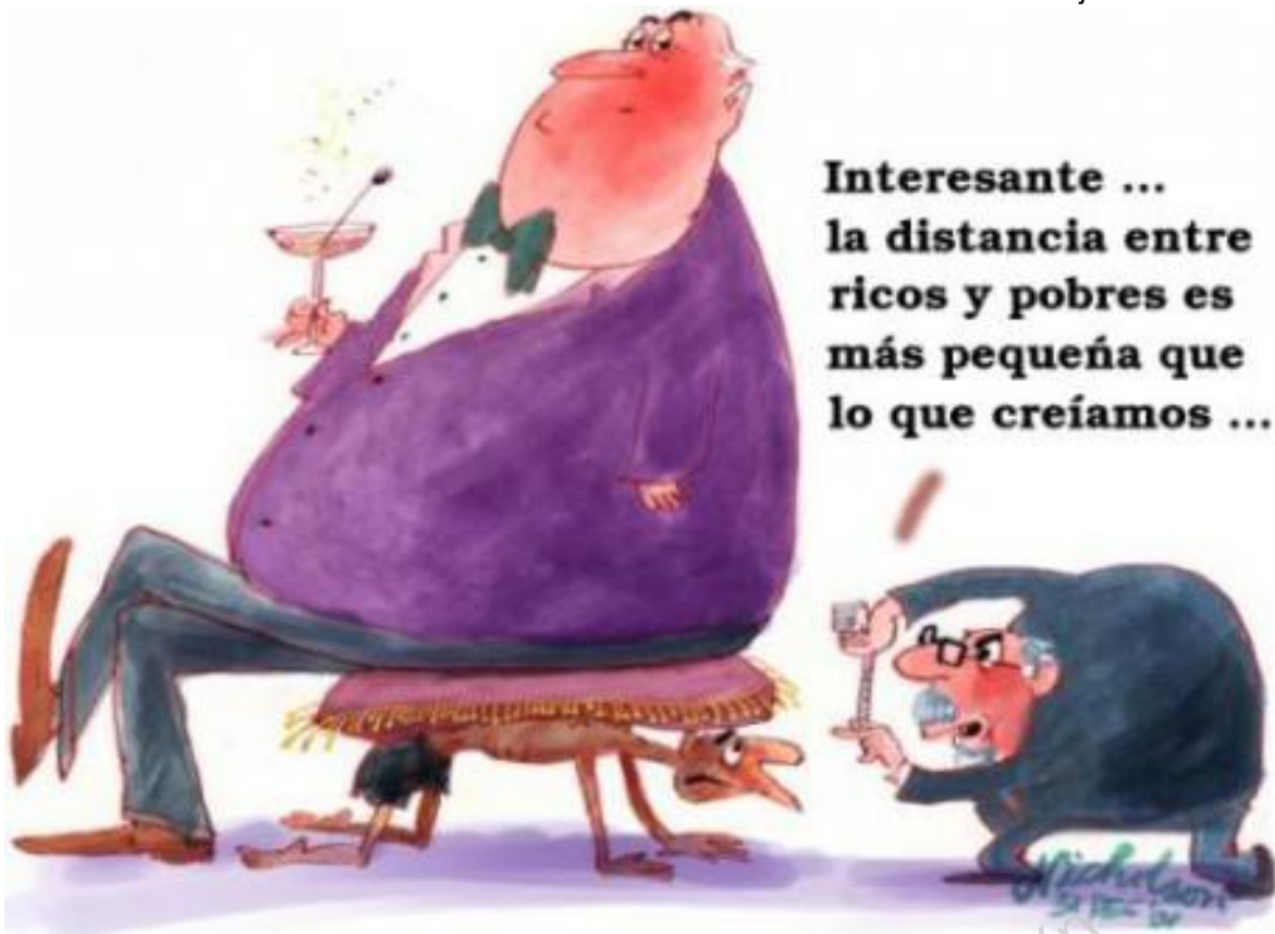
Sin ingenuidad ni mirada "blanca": Ricos y Pobres

La profesión de las personas se reconoce también por su aspecto y, frecuentemente, la forma de adquirir la profesión consiste en llevar los atributos de esa profesión. El médico necesita una bata blanca y un estetoscopio, el pastor debe vestirse con una piel de oveja y llevar un perro y el barrendero tiene que ir con una escoba.