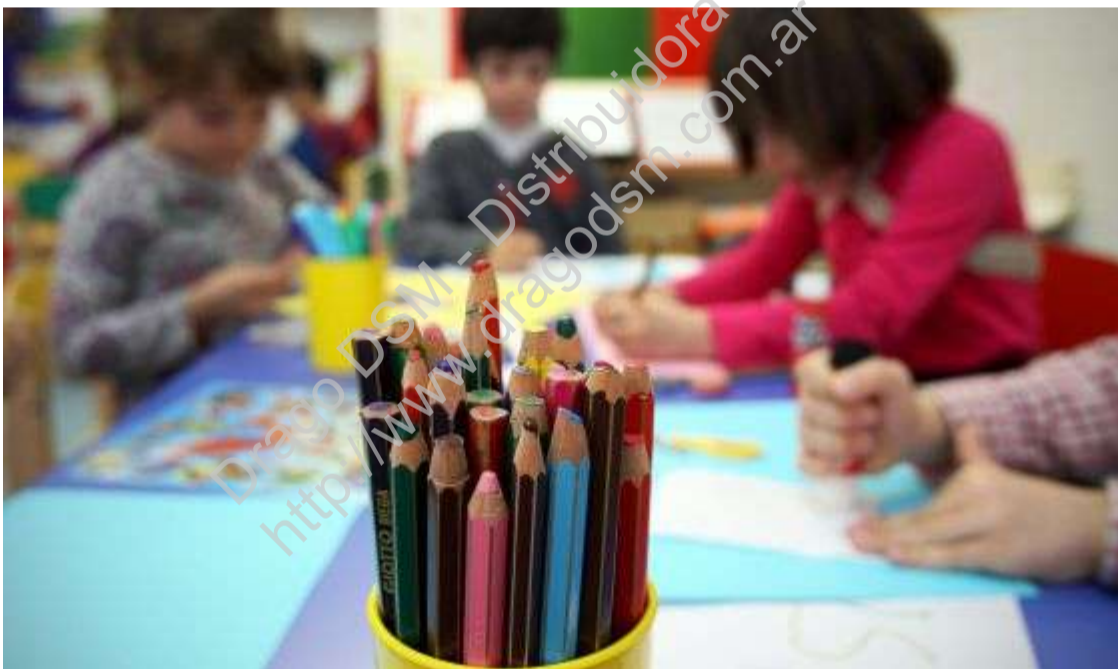
Niños del colegio Aldebarán de Tres Cantos (Madrid).

Algunos informes muestran que la escolarización temprana mejora el rendimiento académico, pero los principales factores determinantes del éxito escolar siguen siendo el origen social y el nivel formativo de los padres.